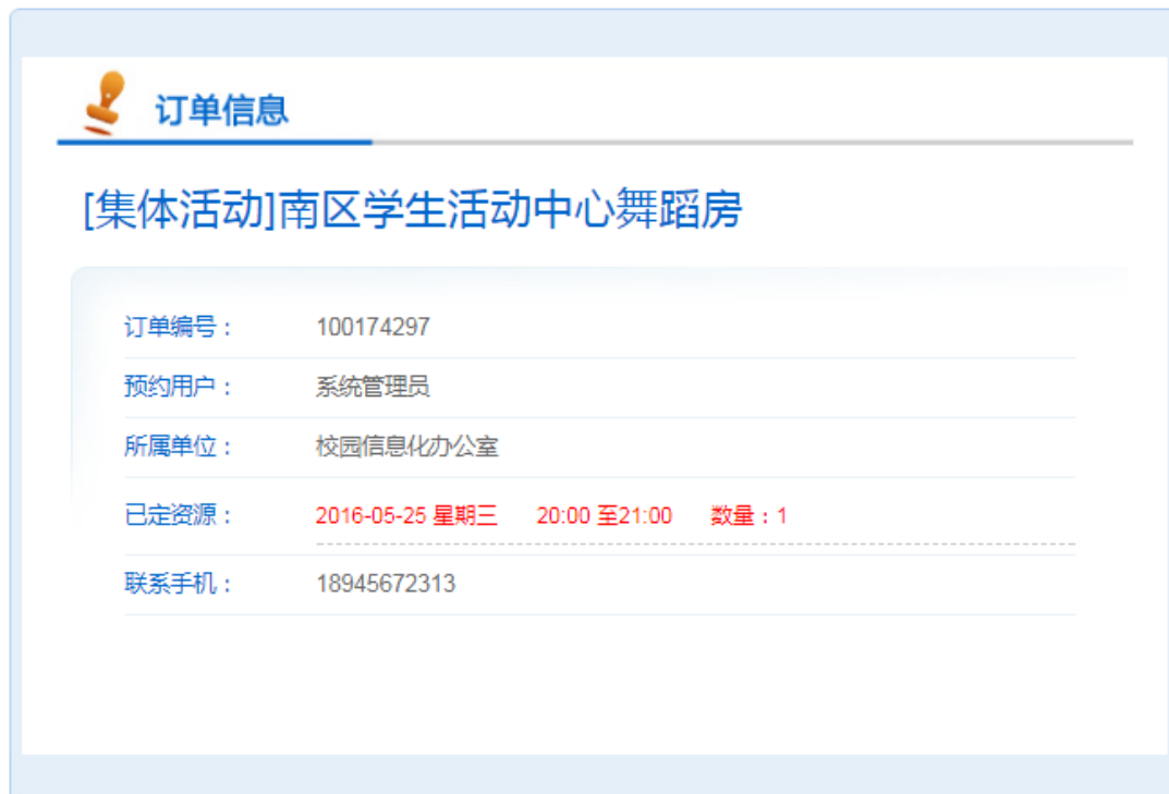
订单详细内容页面